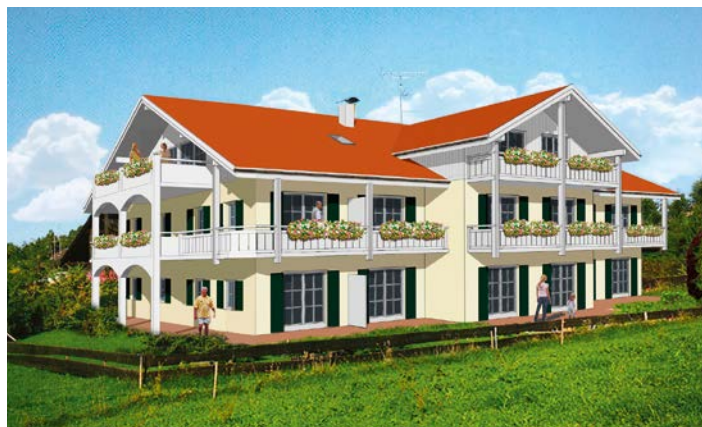
3-D-Animation des Umbaus