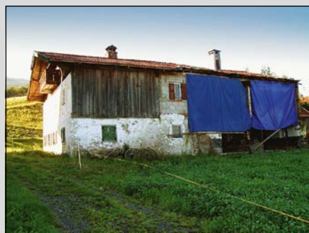
Altbestand vor der Sanierung