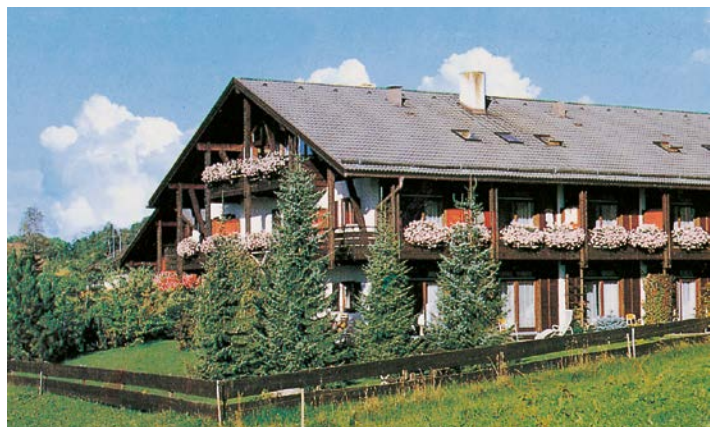
Altbestand vor der Sanierung

Um den Ansprüchen der künftigen Bewohner zu entsprechen, entstanden für eine bessere Belichtung des Dachgeschosses neue Quergiebel, aus den Balkonen Loggien. Neben dem angenehmen Wohnumfeld und den Grünflächen rund um das Gebäude bietet das Haus seinen Bewohnern auch innen nicht alltägliche Entspannungsmöglichkeiten. Der vor wenigen Jahren neu errichtete Wellnessbereich des Hotels blieb erhalten, wurde auf neuesten Stand gebracht und steht nun exklusiv den Bewohnern zur Verfügung.